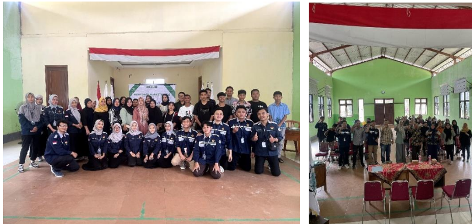
Gambar 5 Foto Bersama Peserta