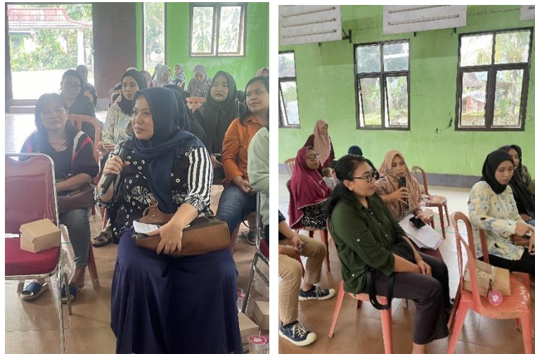
Gambar 4 Sesi Tanya Jawab