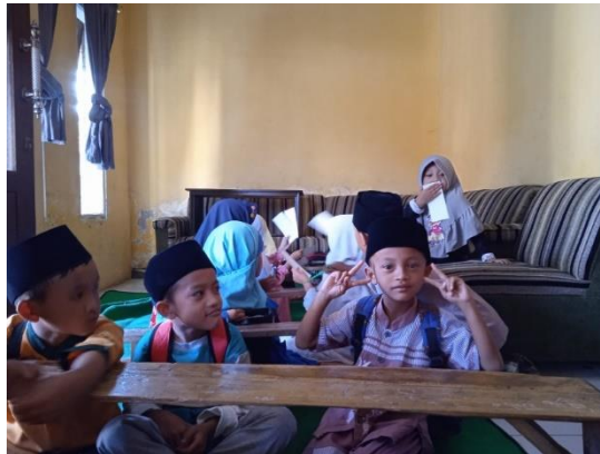
Gambar 3. Anak-anak TPQ Al- Ihsan