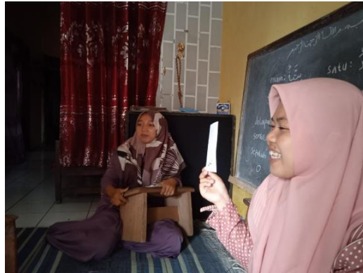
Gambar 1 Pengajaran menggunakan media gambar