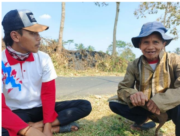
Gambar 2, Bimbingan pendampingan pembuatan NIB

Tahap kedua, Pendampingan dalam pembuatan Nomor Induk Berusaha (NIB) Secara langsung, gunanya agar pelaku UMKM bisa langsung mengerti cara pendaftaran jika mereka ingin mendaftarkan usaha lain di kemudian hari.