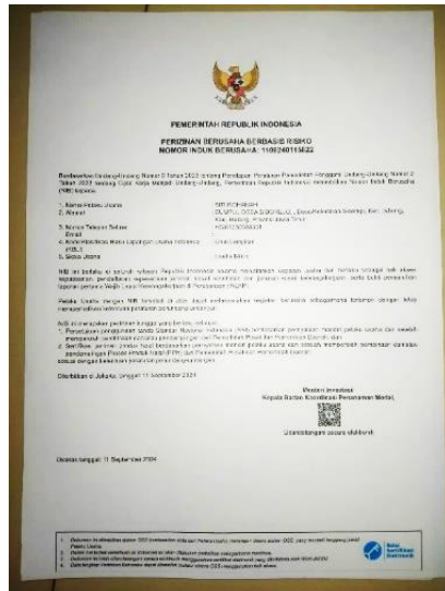
Gambar 3, Hasil Print out surat ijin Nomor Induk Berusaha (NIB) hal. 1

Tahap ketiga , setelah selesai dalam pendampingan dan pendaftaran Nomor Induk Berusaha (NIB) secara online, kemudian hasil dari pembuatan NIB secara online kita cetak.