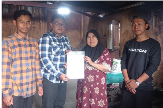
Gambar 5, penyerahan surat izin Nomor Induk Berusaha