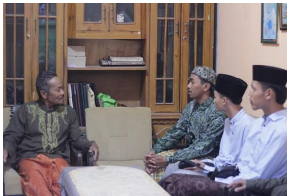
Gambar 1, Bimbingan pembuatan NIB

Tahap pertama, Kelompok pengabdi melakukan survei terhadap warga setempat dan pemerintah di Dusun Tebelo, Kecamatan Jabung. Dengan menggunakan metode survei dan observasi langsung di lapangan. Metode pengambilan sampel informan dipilih secara acak pada masyarakat berusia di atas 30 tahun yang telah memiliki usaha kecil-kecilan dan paham sedikit tentang Nomor Induk Berusaha (NIB) dan legalitas berusaha Kegiatan ini dilaksanakan pada 15 Agustus 2024.