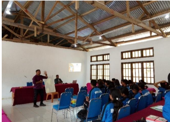
Gambar 2. Penjelasan Matriks SWOT