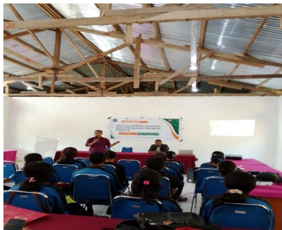
Gambar 1. Penguatan Konsep Kewirausahaan Hasil analisis tersebut dapat disajikan dalam diagram dibawah ini.

Hasil pengumpulan data melalui observasi, angket dan wawancara terhadap 20 siswa kelas XII SMK Negeri 7 Ende menunjukkan bahwa pola pikir wirausaha siswa masih berada pada kategori berkembang, namun belum optimal.